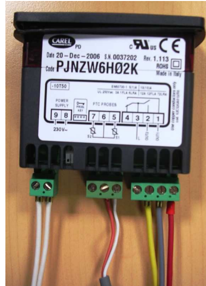
Thermostat CAREL (W6020.1) câblage existant