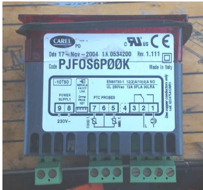
Thermostat CAREL (W1216.1)