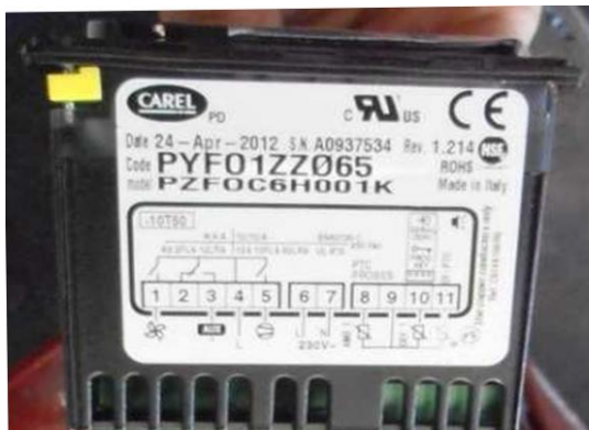
Thermostat CAREL EASY (W1882)

- nouveau câblage à réaliser + remplacement de la sonde si nécessaire